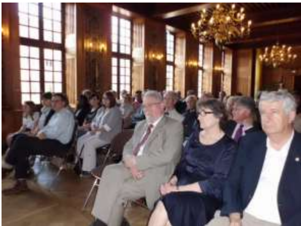
Une vue de l'assistance