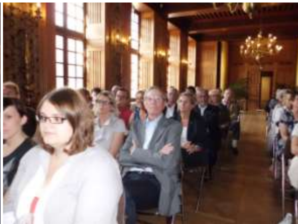
Une vue de l'assistance