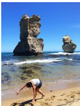
Great Ocean Road