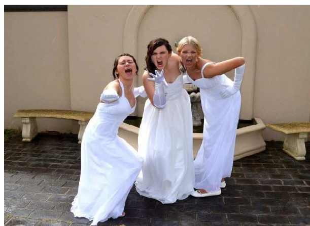
Le Bal des Débutantes